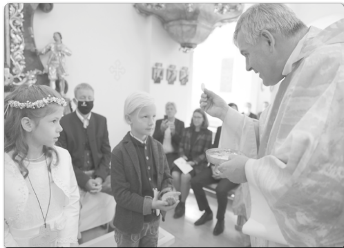
Die sehnsüchtig erwartete Erstkommunion wurde von den Kindern mit großer Andacht und Freude gefeiert.

Danke allen, die so fleißig das Erstkommunionfest vorbereitet und mitgestaltet haben! Dadurch konnten alle Kinder mit ihren Familien ein besonderes Fest feiern!