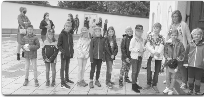
11 Kinder konnten am 27. September endlich das Erstkommunionfest feiern. Davor wurde fleißig geprobt.