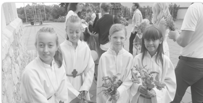
Am Fest Maria Himmelfahrt wurden viele Kräuterbüschel gesegnet und von den Ministranten an alle ausgeteilt.