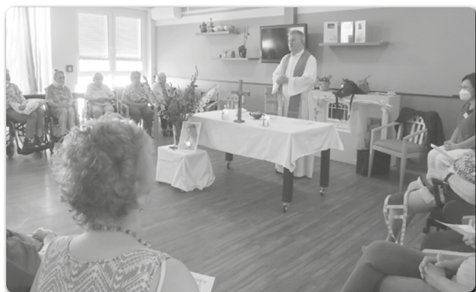
Die Hl. Messen im Pflegeheim werden schön gefeiert!