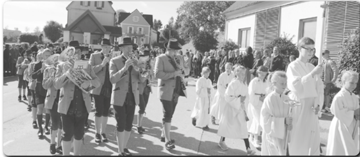
Die Ortmusikkapelle begleitete die festliche Prozession.