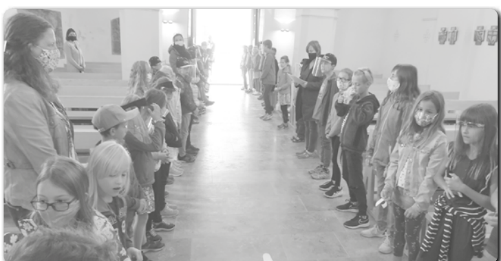
Alle Schüler bildeten für für die 1. Klasse ein Spalier.