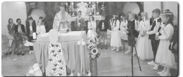
Tauferneuerung mit der brennenden Taufkerze.