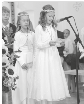
Die Erstkommunionkinder begrüßten alle Gäste am Beginn der Hl. Messe und lasen das Kyrie und die Fürbitten.