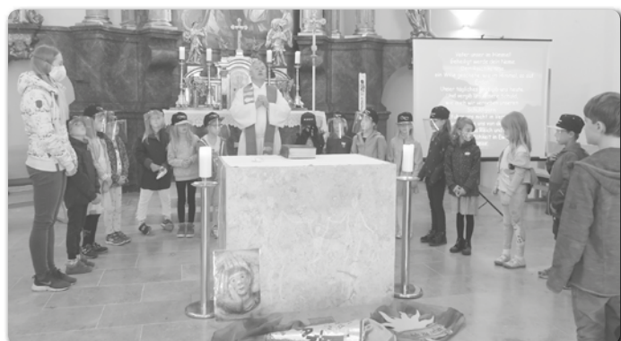
Die 1. Kl. der VS werden beim Vater unser vorgestellt.