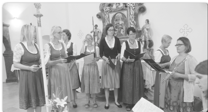
Der Familienchor gestaltete die Hl. Messe am 15. Aug.

Termine: Mo, 9.11. von 14:00-17:00 Uhr und am Di, 10.11. von 14:00-17:00 Uhr im Pfarramt Heiligenkreuz am Waasen. Bitte Geburtsurkunde und den Taufschein (wenn vorhanden), ein kleines Foto von Dir und 50.- € Beitrag zur Anmeldung mitbringen! Anmeldeformular: www.pfarre-heiligenkreuz.at