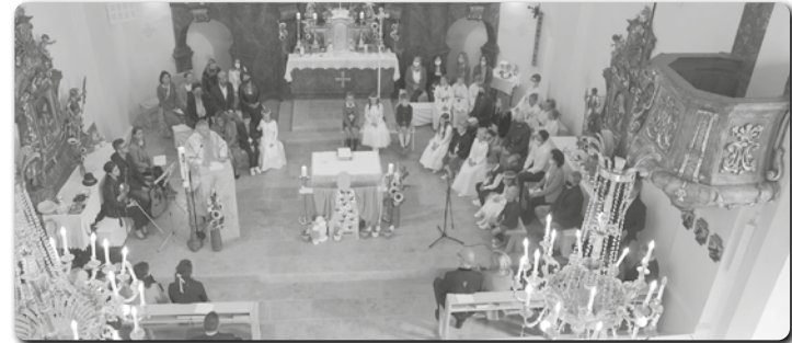
Die Kinder feierten mit ihren Paten im Altarraum mit.