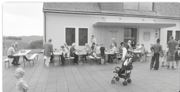
Nach der Kräutersegung lud der PGR zur Agape ein.