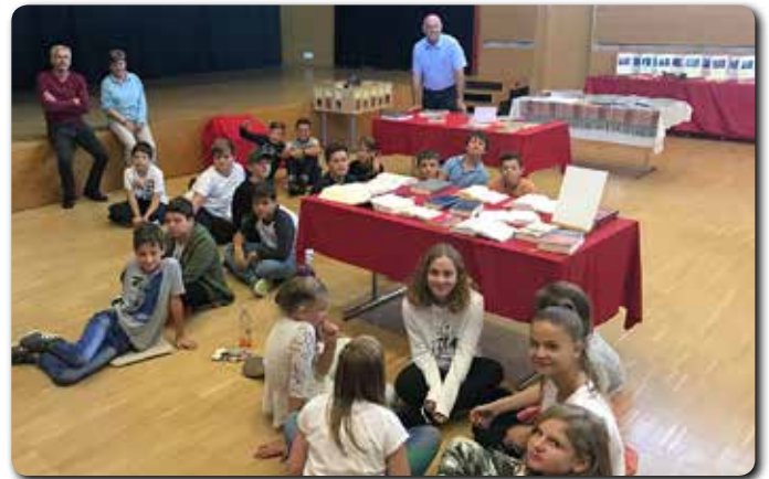
Die vielen Klassen der Neuen Mittelschule besuchten die Bibelausstellung und nahmen auch am Bibelquiz teil.

Ursprünglich komme ich aus Pischelsdorf, wo meine Familie bereits in vierter Generation einen traditionellen Gasthaus- und Fleischereibetrieb führt. Dort bin ich auch zur Volksschule gegangen, bevor mich die Begeisterung für Musik in die Musikhauptschule nach Weiz gezogen hat. Maturiert habe ich in der Südsteiermark, an der Tourismusschule in Bad Gleichenberg, Religionslehrerin werden, das wollte ich aber eigentlich schon seit ich etwa vierzehn war: Ich hatte den Wunsch, mit Kindern, Jugendlichen und jungen Erwachsenen zu arbeiten. Diesen Wunsch mit meiner Begeisterung und dem Interesse für Religion(en), Glaube und Kulturen zu verbinden ergab für mich die perfekte Kombination. Ich freue mich außerdem besonders darüber, dass ich meine Freude für Musik nicht nur in meiner Freizeit, sondern auch in der Schu-