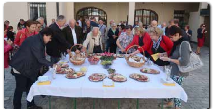
Alle Teilnehmer der Familienmesse und auch wir Gäste aus Heiligenkreuz waren zu einer Jause im Dompfarrhof eingeladen!