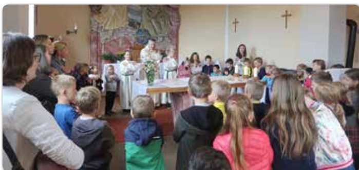
In der Kapelle Empersdorf wird das Vater Unser gesungen.