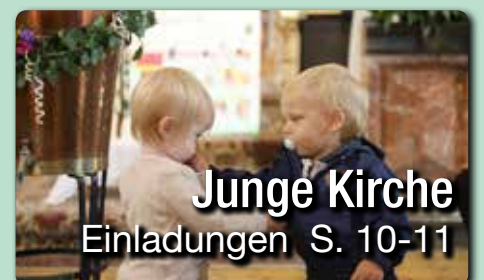
Junge Kirche Einladungen S. 10-11