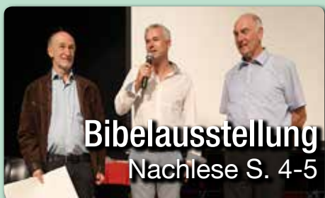
Bibelausstellung Nachlese S. 4-5