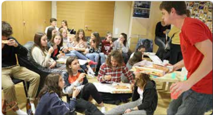
Startfest der Kath. Jugend am 20.9. im Jugendraum des KPZ.