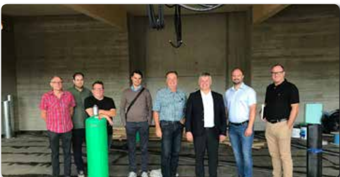
Die neue Aufbahnhalle wird aufgrund von Bauverzögerungen in der zweiten Novemberhälfte 2019 fertiggestellt.