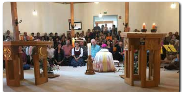
Bischof Dr. Wilhelm Krautwaschl predigte auf Augenhöhe im Haus der Stille und dankte für das große Engagement vieler.