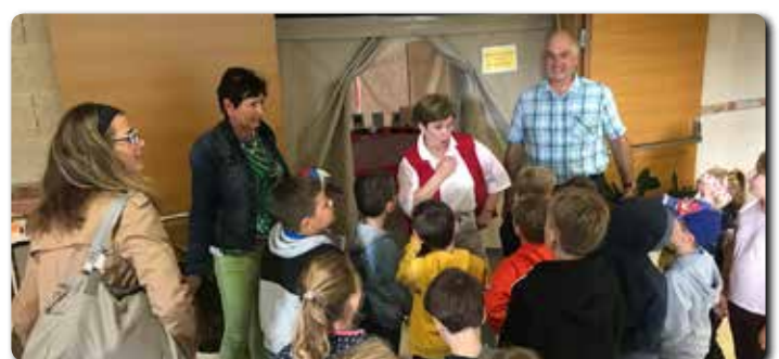
Kinder der VS Heiligenkreuz besuchen die Bibelausstellung.