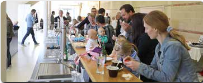
Die Taufkinder von 2018 und 2019 waren mit ihren Eltern und Paten in die Pfarrkirche und zur Agape ins KPZ eingeladen.