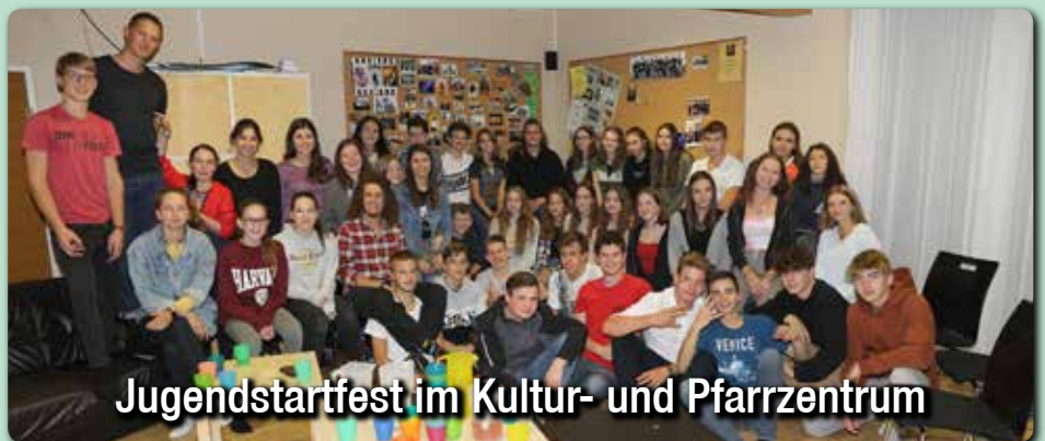
Jugendstartfest im Kultur- und Pfarrzentrum

St. Ulrich: ÖKB-Gedenkfeier u. Hl. Messe