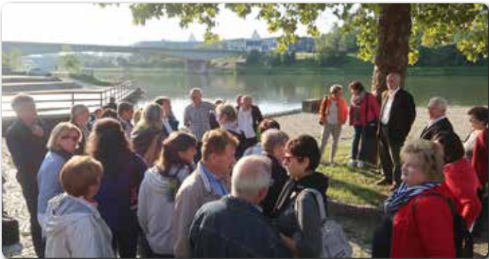
Nach einer Stadtführung in Marburg und zur Drau und der Hl. Messe zeigte der Dompfarrer den schönen Marburger Dom.