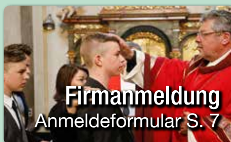
Firmanmeldung Anmeldeformular S. 7