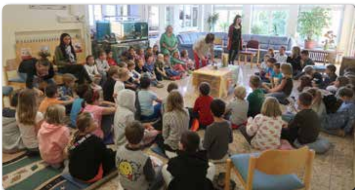
Die Volksschulen starteten ins neue Schuljahr auch mit einem Schulgottesdienst: Hier in der Volksschule Edelstauden.