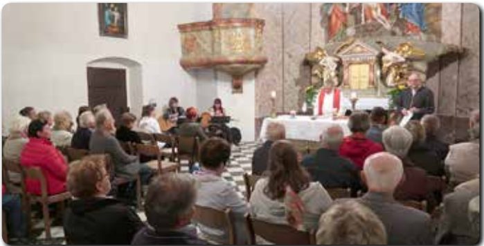
Am 26.9. feierte die Kath. Männerbewegung und die Kath. Frauenbewegung eine schöne Hl. Messe in der Bergkirche.