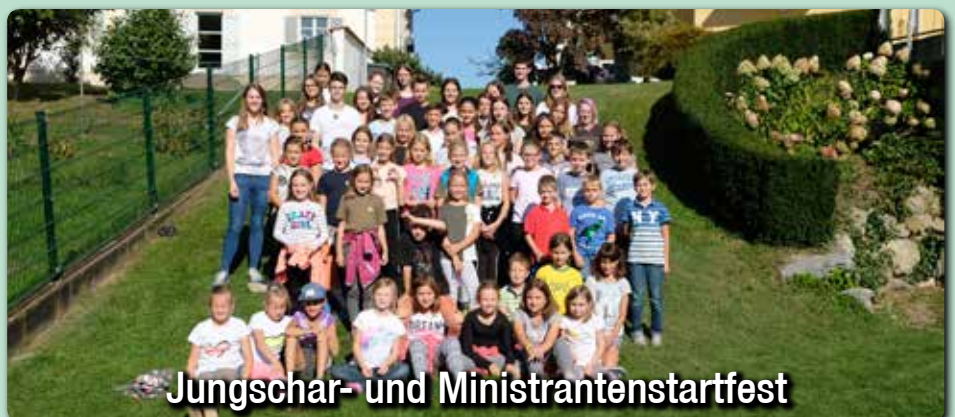
Jungschar- und Ministrantenstartfest